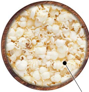
Palomitas de Maiz